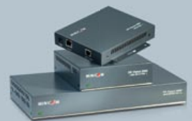
DS Vision 3000 - Vorderansicht